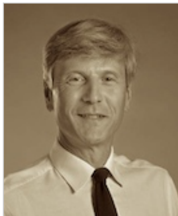
Le père B.

La clé et l'aide pour une telle attaque vraiment vicieuse en septembre a pu être le père de la codemanderesse